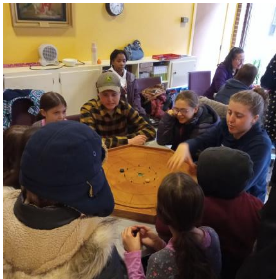
La réunion sociale .